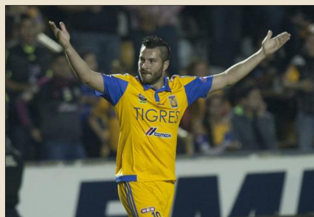
■ Depuis son arrivée, Gignac s'éclate !

André-Pierre Gignac a signé son deuxième coup du chapeau depuis son arrivée au Mexique avec les Tigres de Monterrey.