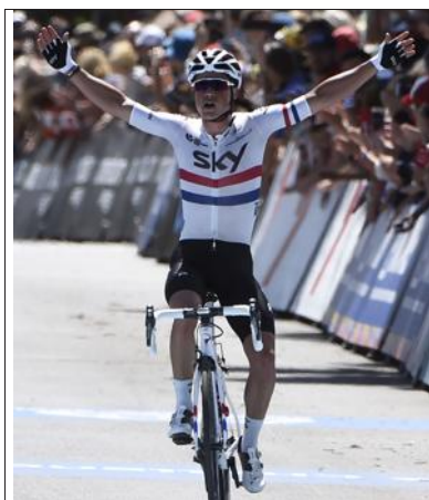
■ Le champion de Grande-Bretagne Peter Kennaugh.