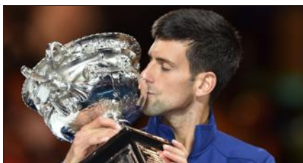
■ Novak Djokovic.