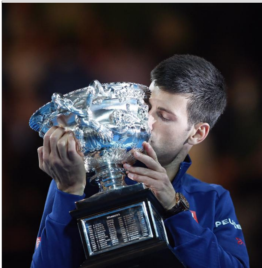
■ Novak Djokovic.

Djokovic partait archi-favori contre un adversaire qu'il a maintenant battu onze fois sur leurs douze dernières rencontres, et quatre fois sur quatre en finale de l'Open d'Australie. Le Serbe n'a une nouvelle fois pas déçu... Monumental !