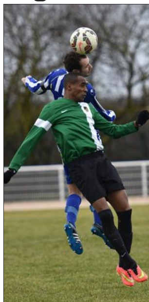
■ Résultat nul hier à Ratel.

Les locaux se procurent de sérieuses opportunités mais pêchent dans la finition. Ils reviennent au score sur un penalty de Barnou (1-1, 55 e )