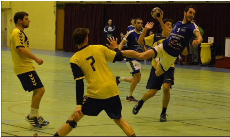
■ Bonne opération pour Naudin et Beaune.

Beaune est parvenu à l'arrachée à prendre les points de la victoire en Lorraine sur le parquet de Neuves-Maison (30-31).