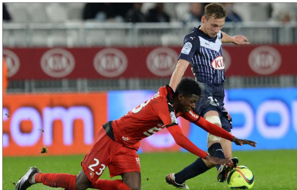
■ Ousmane Dembele et Rennes ont chuté devant les Bordelais de Clément Chantôme.