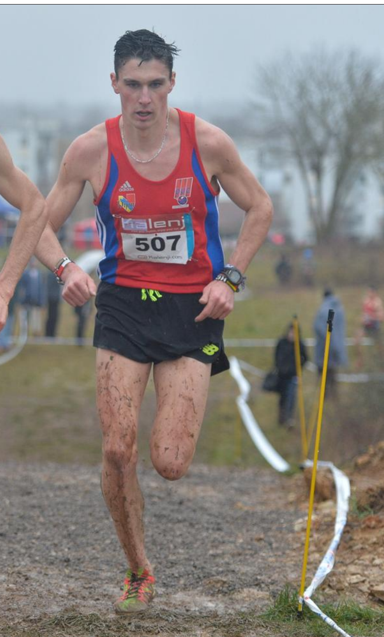
L'AC Chenôve a alors placé une accélération décisive.