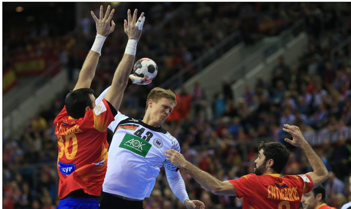
■ Pourtant favorite, l'Espagne n'a rien pu faire face à Niclas Pieczkowski (en blanc) et l'Allemagne.

À la manœuvre de cette entreprise de destruction massive : Kai Häfner. Celui qui avait offert la qualification aux siens, en demi-finale, à cinq secondes du terme de la prolongation... trois jours seulement après son arrivée en Pologne comme joker médical. En inscrivant d'entrée un retentissant triplé face à une Roja hagarde, l'arrière droit allemand plaçait les siens sur la route menant au paradis (4-1, 8 e ). Et comme, de l'autre côté du terrain, la défense installée par le sélectionneur Sigurdsson grippait la machine espagnole à grands renforts d'engagement physique total. Le score s'enflammait (10-6 à la pause). Une tendance que le retour aux vestiaires chancelant des Ibériques ne parve-