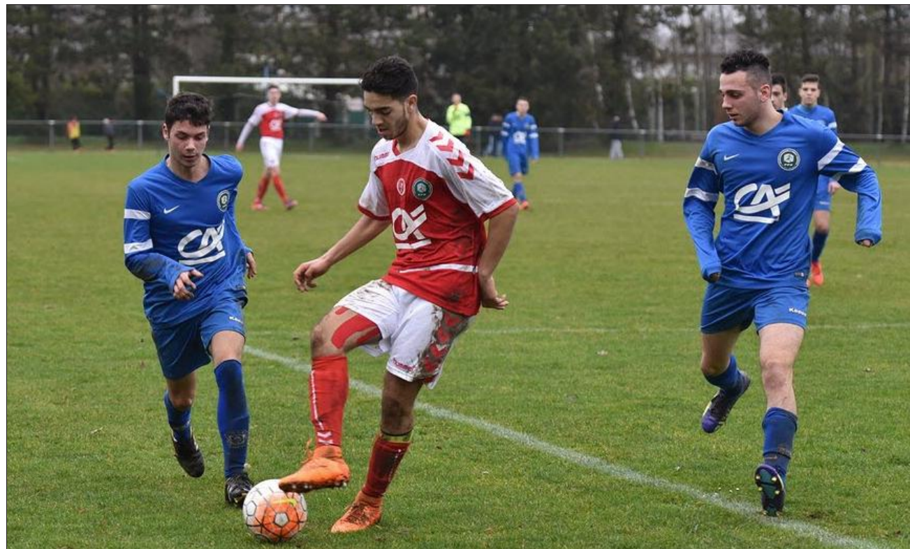
■ Les Chevignois (en bleu) ont été balayés par le Stade de Reims ce dimanche.

« La logique a été respectée, Reims a fait un très bon match. On a lutté comme on pouvait », poursuit le technicien. Les Bourguignons