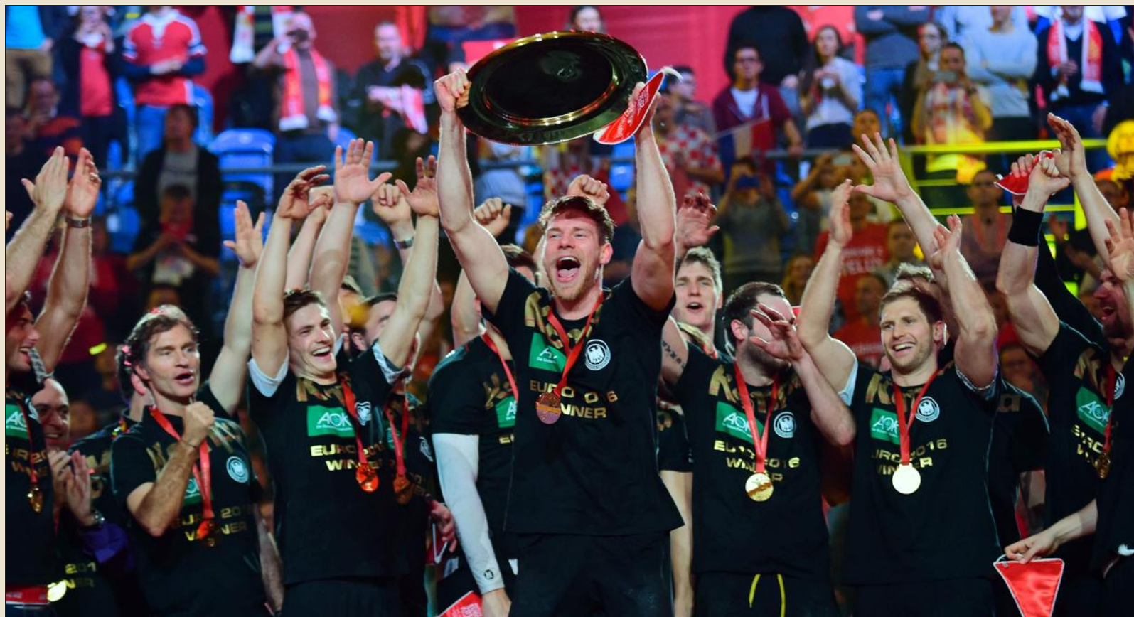
■ L'Allemagne peut exulter après avoir dominé l'Espagne en finale, et remporté le championnat d'Europe.

La joie allemande est à la hauteur de la surprise provoquée par la victoire. C'est le deuxième titre continental des Allemands après celui de 2004 et il leur offre une qualification directe pour les Jeux de Rio où ils compteront parmi les favoris avec la France, double tenante du titre.